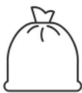
Sække og poser