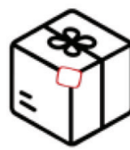
Pakker hvor label ikke kan scannes