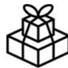
Uens pakker bundet sammen