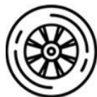
Dæk og fælge